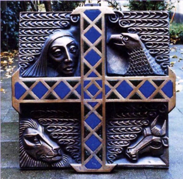
1985 Berlin-Spandau, St. Johannesstift Vier Evangelisten, Bronze und Email, 70 x 70 cm im Andachtsraum des medizinischen Zentrums.