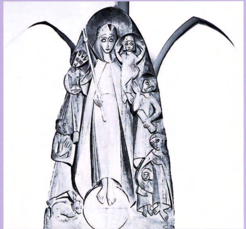
1956 Dortmund-Brakel, kath. Pfarrkirche »Maria-Königin-Altar«, 2,20 m hohes Holzrelief aus Eiche in eine gotische Nische eingepaßt.

Texte aus der Dissertation von Judith Dahmen-Beumers