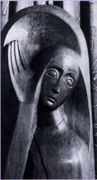
1957 Dortmund-Marten Immakulata, Eiche, 235 cm hoch, Marienaltar, Detail.