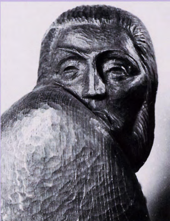
1951 Riesa Stadtmuseum Judas Iskariot, Eiche, 91 cm hoch, Detail