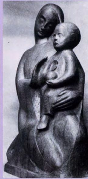
1957 Klosterkapelle Bottrop Madonna mit Kind, Eiche, ca. 90 cm hoch.