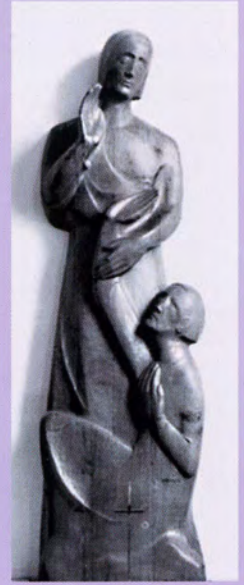
1960 Kirche in Velbert, Herz-Jesu, Eiche, ca. 2 m hoch, Seitenaltar.