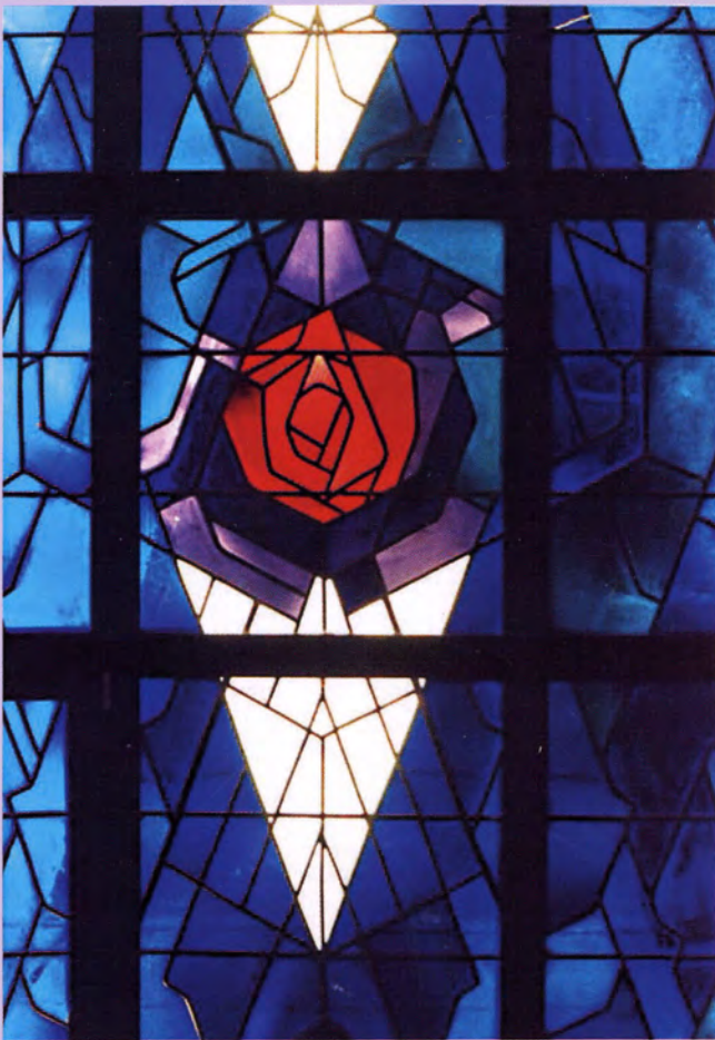
1991 Altena, Katholisches Krankenhaus Schöpfung, Antikglasfenster, 350 x 180 cm.

(alle Fenster wurde ausgeführt durch Glasmalerei-Werkstatt Oidtmann, Linnich)